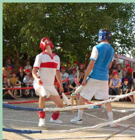
Quand les codes du sport sont détournés sur un ring. Théâtre de rue - Tout public