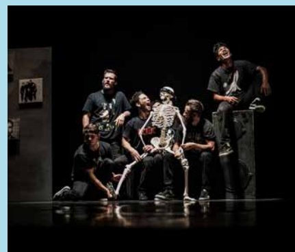
Passerelle entre les musiques rock et la danse hip hop.