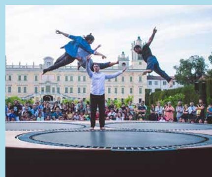
Une pièce de cirque généreuse où l'engagement physique est au cœur du propos.